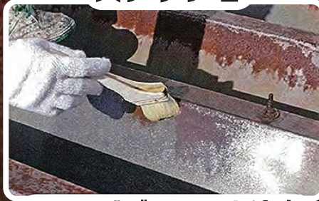
TSサビブロックを塗布