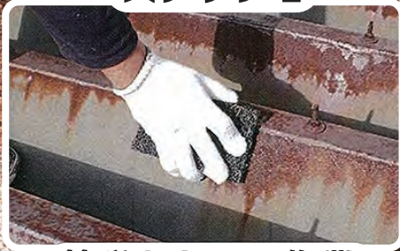
簡単なケレン作業