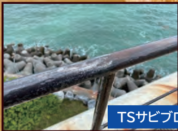
TSサビブロック施工写真